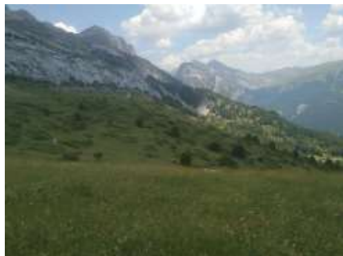
Collado de Lenito