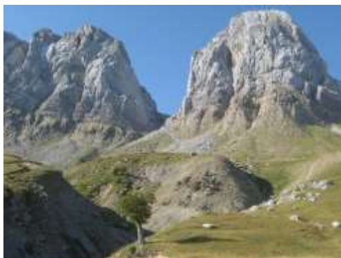
Collado de Alano

La salida se realiza por pista desde el camping de Zuriza, dirigiéndonos al llano de Tacheras donde es posible pasar el río Tacheras, estamos debajo de los “Alanos” y aquí empiezan las primeras huellas del oso Camille (unas garras azuladas) que en un ascenso zigzagüeante espectacular nos coloca en el collado del Achar de Alano. Llegamos a una impresionante zona herbosa ente los farallones de los Alanos, Peña Forca y Lenito. Bajaremos por el estrecho de Arralla y ponemos rumbo al barranco de la Reclusa hasta el refugio de Choza Fimia por donde comenzaremos a subir un sendero precioso entre hayedos hasta el collado de Lenito, donde comienza el descenso muy bonito hasta el Puente de Santa Ana, cruce de carretera entre Oza – Hecho donde termina nuestra travesía. Zona de contrastes y poco transitada que discurre por la zona menos visitada de la Sierra de Alano.