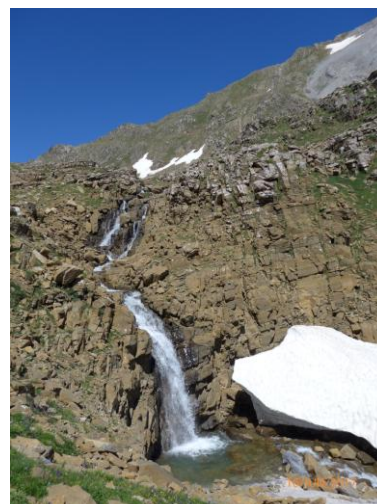
Foyas de Aragües