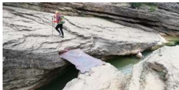
Puente sobre el Río Valcez