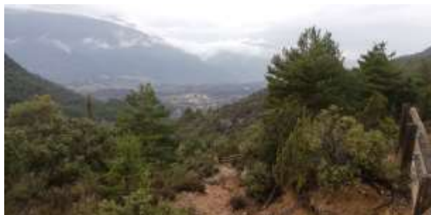
Las Almunias desde el Collado de las Almunias