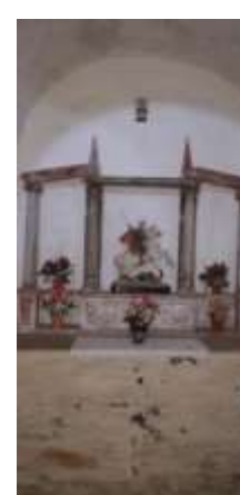
Vistas de las Capileiras