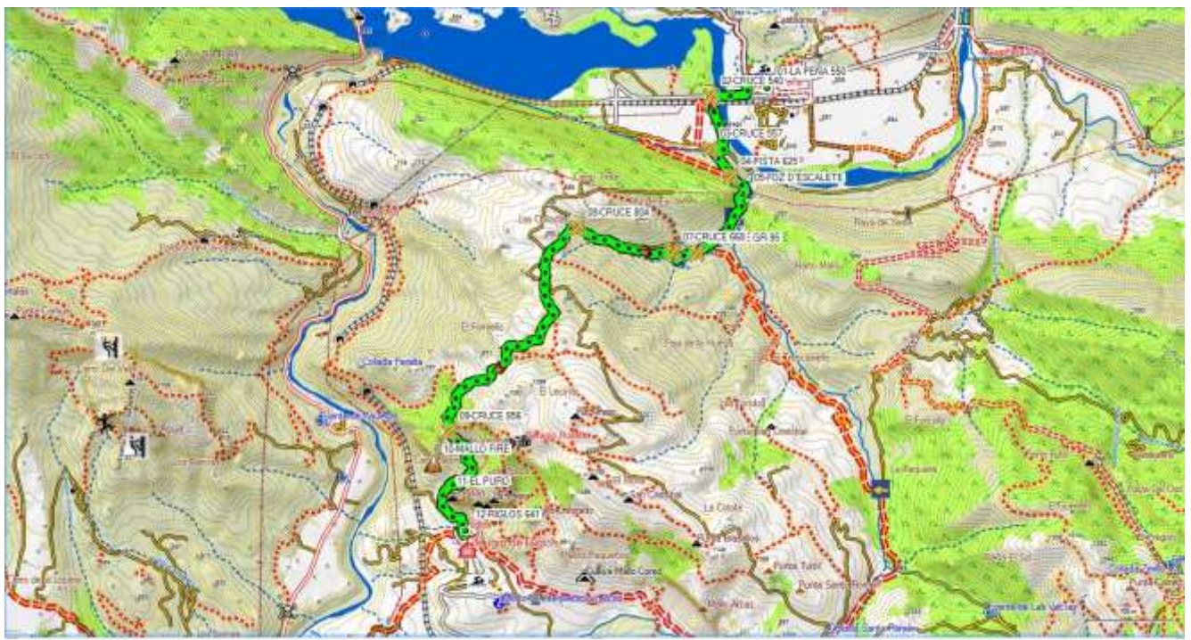
(Mapa del recorrido)