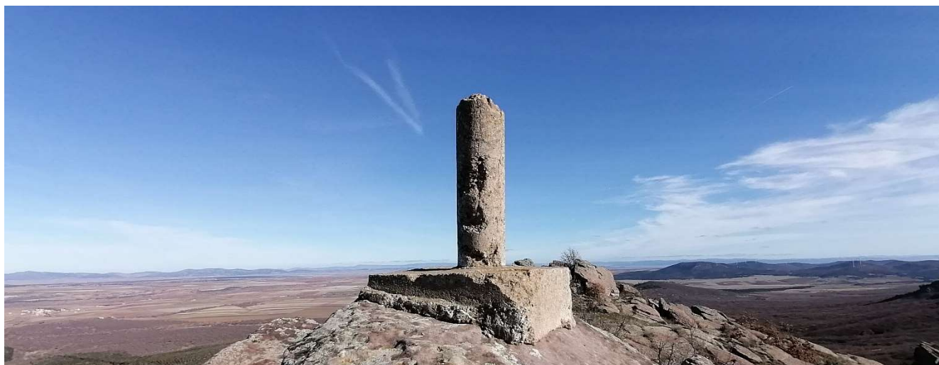
Vértice Geodésico Pico Lituro 1457 m