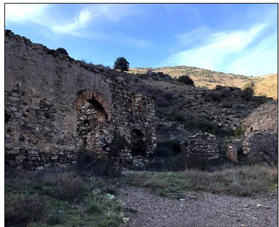
Minas de Valdeplata