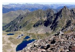
Ibon de Boums