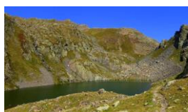
Puerto de La Glera