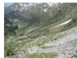
Subida al Portillon de Benasque