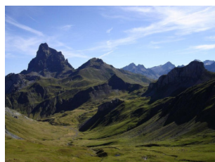
Pico Canal Roya. Anayet al fondo

Ruta lineal localizada en la entre la divisoria del Valle del Aragón-Valle de tena y Ossau en los Pirineos Centrales. Los amantes de la montaña encontrarán uno de los picos más emblemáticos de los Pirineos, el Midi d'Ossau (2.884m) y una buena red de caminos para practicar el senderismo. Comenzamos en la estación de esquí de Astún, para terminar en el puerto de Portalet d'Anéou. El primer tramo seguiremos el Barranco de Escalar, donde encontraremos el mayor desnivel de la ruta, pasando por el Ibón de Escalar para llegar al Col des Moines. Continuaremos por la línea divisoria de las regiones de Aquitania (Valle de Ossau) en la ladera norte y