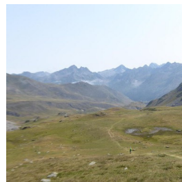
Pla de la Gradiellere 2080