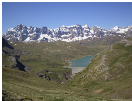
EMBALSE DE ESCARRA AL FONDO LA SIERRA DE LA PARTACUA