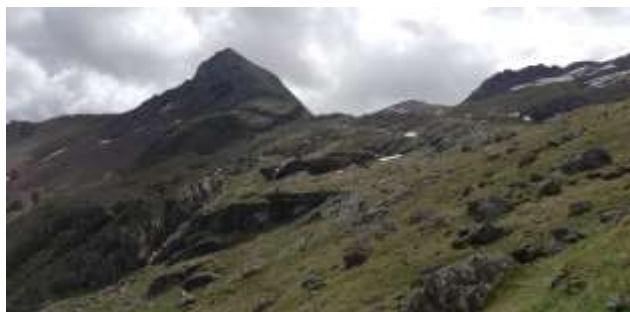
El barranco y Punta Negra