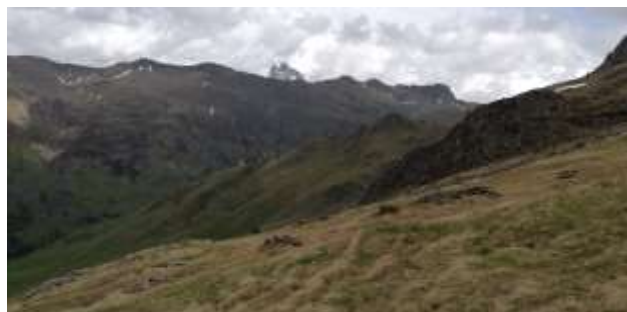
Canal Roya y el Midi