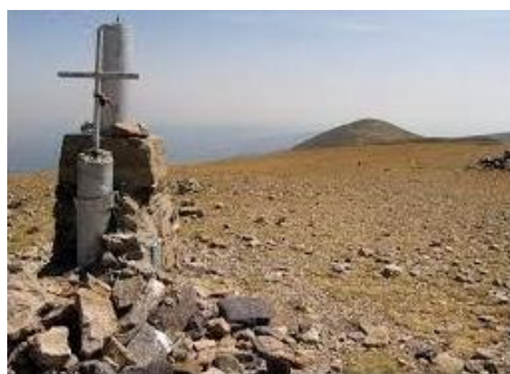
Cima del Moncayo