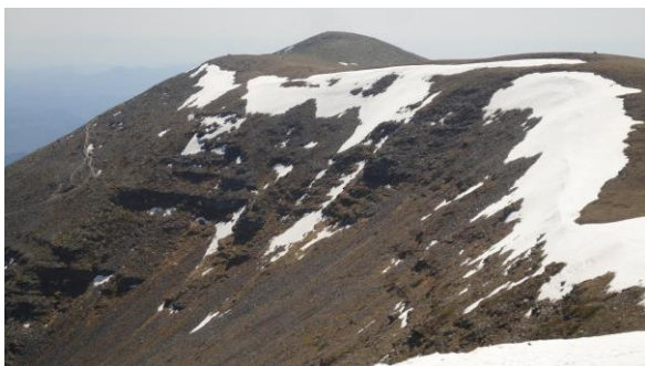
Moncayo o Pico de San Miguel

Desde aquí y siguiendo el sendero casi por la loma, que cruzaremos un par de veces la carretera nos dejara el el aparcamiento de la Fuente de los frailes, donde terminará nuestra excursión.