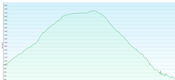
Monasterio de Valvanera- Venta de Goyo