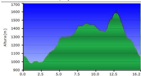
(Perfil del r